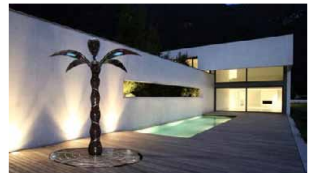
Palm Shower présenté sur l'espace innovation en 2012