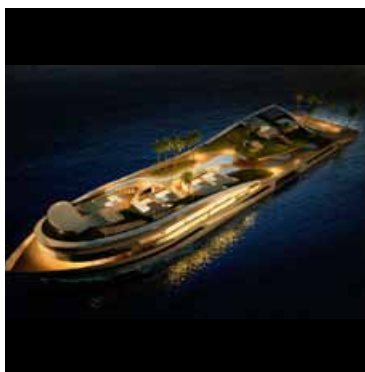
Island (e) motion