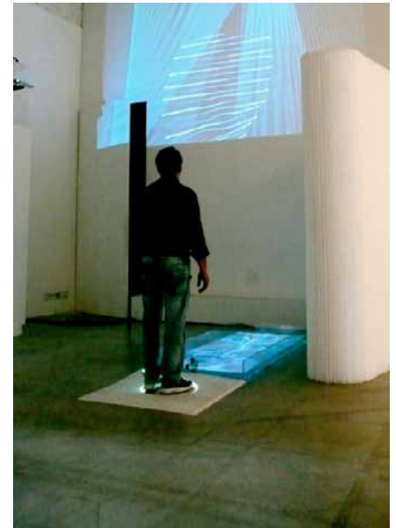
© EX- ÎLES - COPYRIGHT ELECTRONIC SHADOW

En référence à son nom, 1.618 propose sa vision de l'harmonie universelle et offre une vision positive de demain en déculpabilisant le discours sur le développement durable.