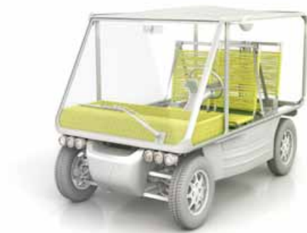
VOLTEIS BY STARCK, LAURÉAT DU PRIX 1,618 DU JURY 2012