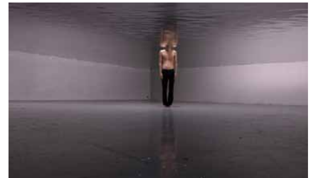
« De larmes et d'eau fraîche » exposition 2012: 10 artistes, 14 oeuvres

Consacré à tous ceux qui anticipent les mutations et envisagent demain avec une vision positive et dynamique, l'espace innovation présente un choix de réalisations et d'initiatives où innovation et développement durable concourent à nous projeter dans un futur esthétique, vivable et optimiste.