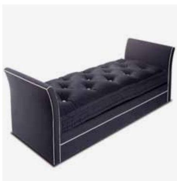
Le lit national